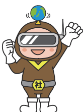
しゃかいブラウン