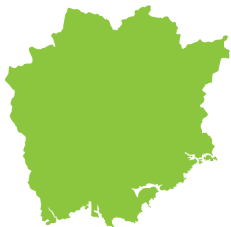
問 1 おかやまけん 岡山県

※大きさのひりつと方角は同じではありません。また、島は一部省りやくしてあります。