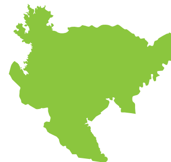
問 3 さがけん 佐賀県