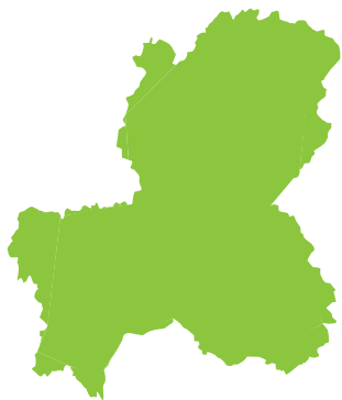
問 4 ぎふけん 岐阜県