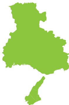
問 5 ひょうごけん 兵庫県