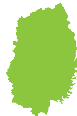
問 6 いわてけん 岩手県